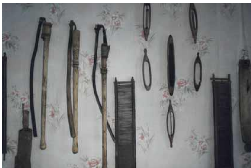
Детали одежды из пестряди.