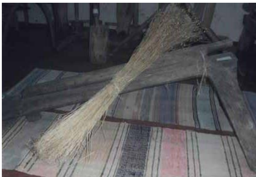
Полотенце из узорной льняной ткани.