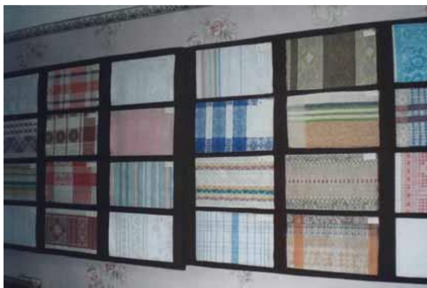
Образцы изделий Красавинского льнокомбината.

Но мы должны помнить, что в хозяйстве России всегда были две главные опоры – рожь и лен. Мы не должны забывать трудовые традиции своего народа.