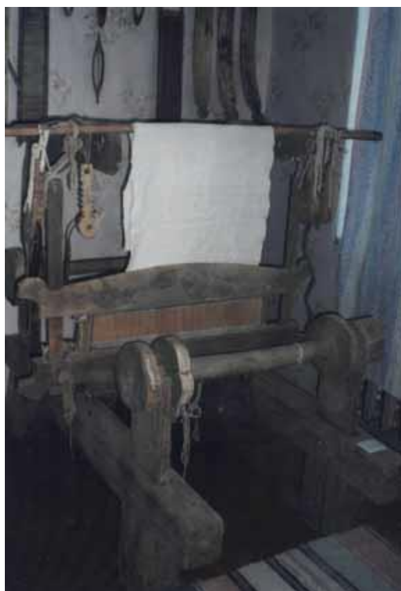
Ткацкий станок из д. Полутово.