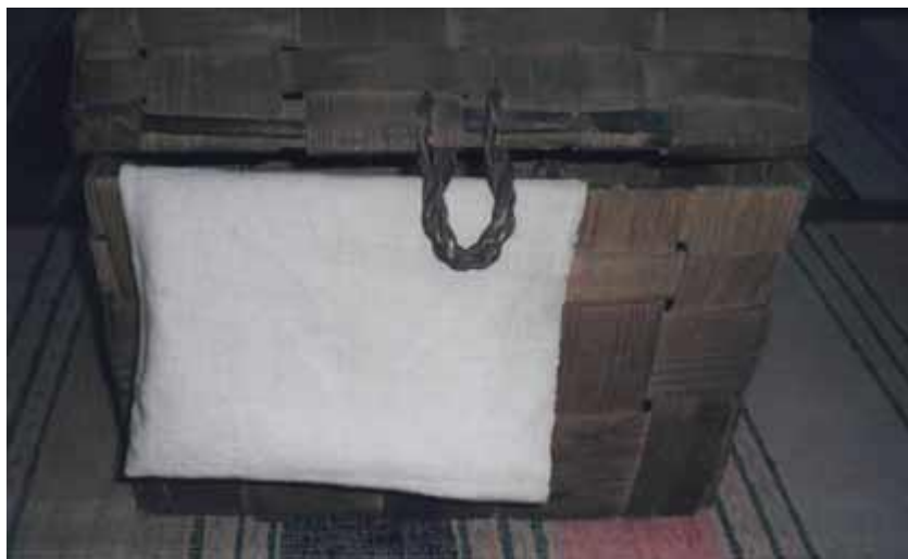
Коробья из д. Бушково.