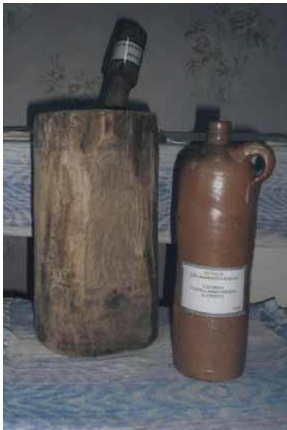
Ступа. Бутыль для хранения льняного масла.